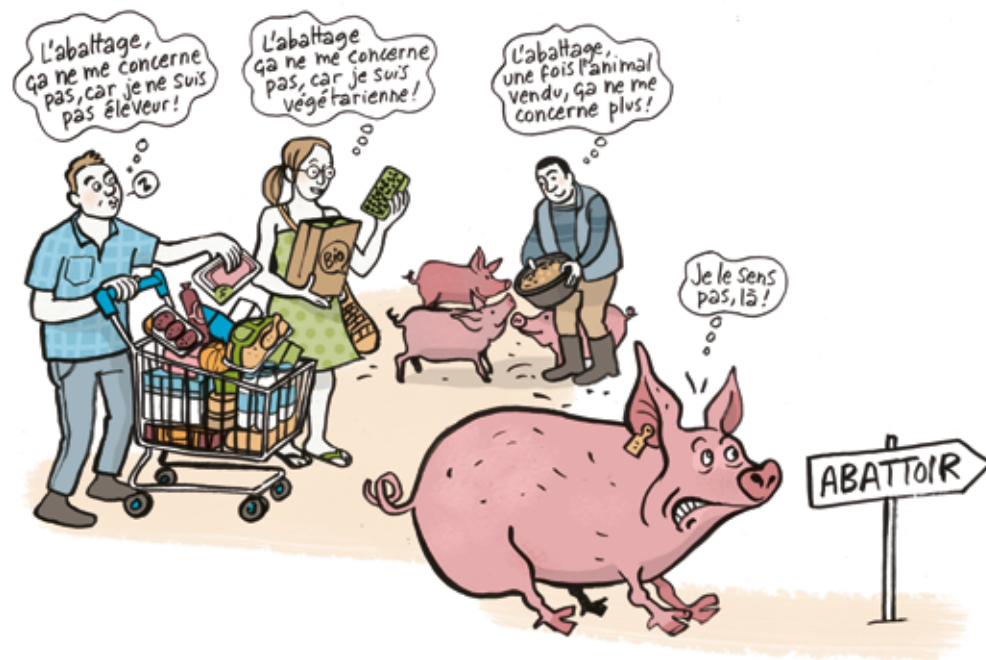
LE PROCESSUS D'ABATTAGE CONVENTIONNEL (JUSQU'À LA MISE À MORT)