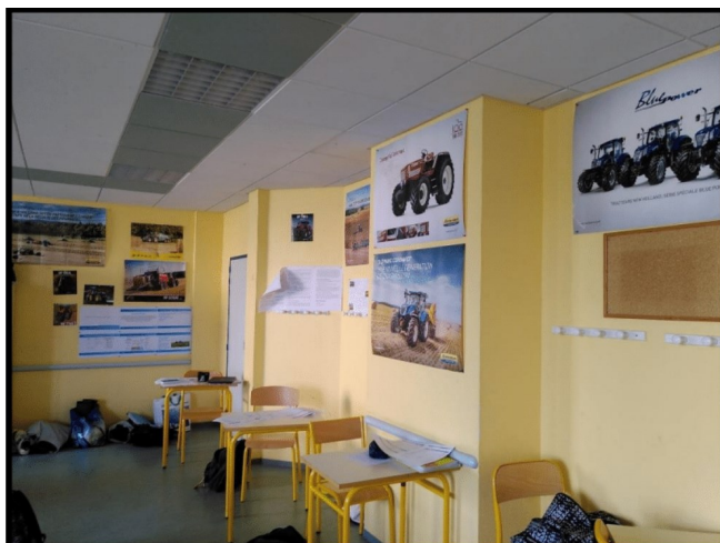
Salle de classe de lycée agricole

posées à des classe de Bac Pro, de BTS agricole, de CAP métier de l'agriculture ou encore à des BPREA dans plusieurs départements : Aube, Haute-Marne, Ardennes, Meurthe-et-Moselle, Moselle.